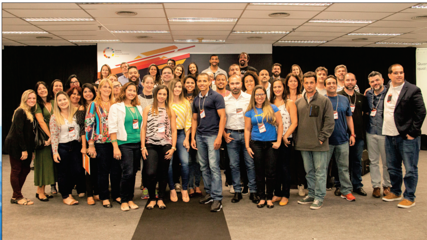
O setor fitness em busca de união e força: o grupo participante do 8º Fórum Sebrae Mercado Fitness

- Estamos oferecendo informações cada vez mais personalizadas sobre o setor e isso tem ajudado as empresas que nos acompanham a melhorar sua gestão. É um trabalho contínuo - disse ele.