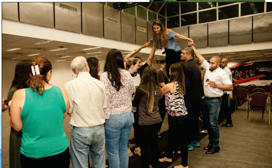
Dinâmica sobre gestão de conflitos: desafio gerou discussões e aprendizados